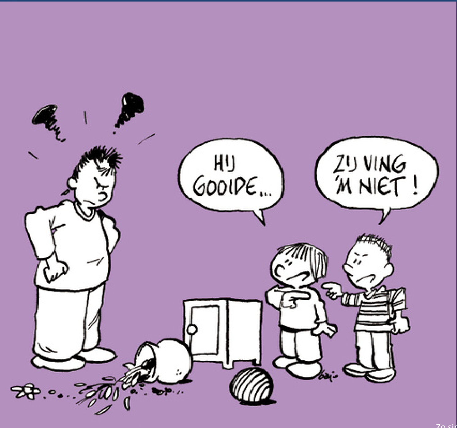
Zo simpel kan samenwerken zijn